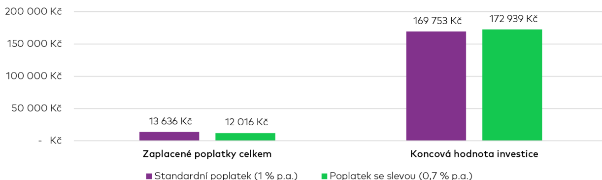
Srovnání výše zaplacených poplatků a hodnoty investice pro příklad uvedený výše

V uvedeném příkladu bylo naučtováno celkem 2 351 Kč na doúčtovaných poplatcích za předčasný výběr před skončením nastaveného fixovaného období. I přesto jsou celkové naučtované poplatky (Správcovský poplatek se slevou a poplatky za 2 předčasné výběry) na portfoliu s aktivním 10letým fixovaným obdobím nižší, než by při stejném scénáři a stejných výběrech bylo naučtováno na portfoliu bez fixovaného období. Využití Slevového programu je tak vždy (tedy i pokud jsou z něj peníze vybírány před koncem fixovaného období) poplatkově výhodnější než jeho nevyužití. Shrnuje to následující obrázek: